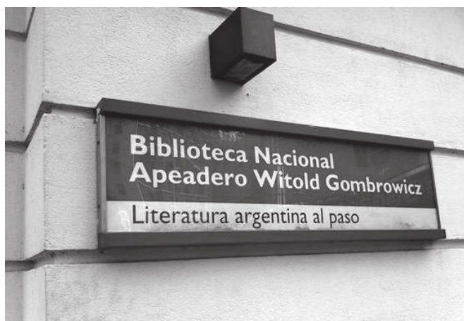
Fot. 4. Tablica na budynku BN