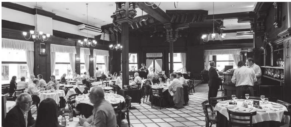
Fot. 1. Wnętrze El Querandí (aktualnie)