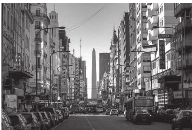
Fot. 2. Widok na El Obelisco z Av. Corrientes

Miejscowe przygody Gombrowicza kończą się pobytem w szpitalu Carlos D. Durand.