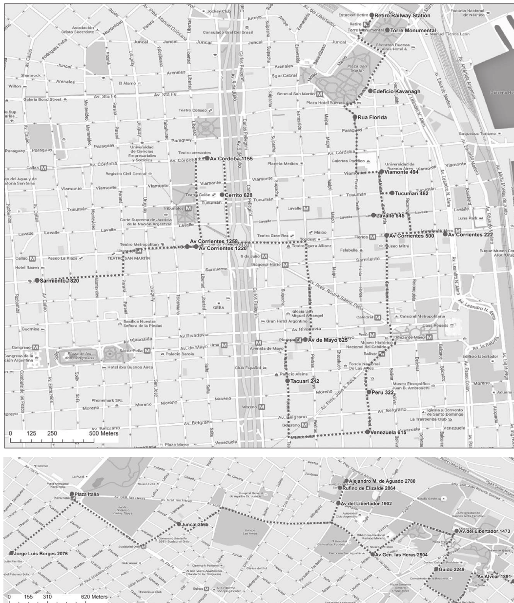
Rysunek 2. Projekt szlaku – A: dzielnice Retiro, Microcentro, San Telmo, La Boca, B: dzielnice Recoleta, Palermo