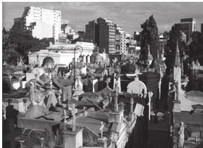
Fot. 3. Widok na Cmentarz Recoleta

www.infoesquelas.com/articulos/reportajes/cementerio-de-la-recoleta-buenos-aires/4584 [dostęp: 5.03.2018].