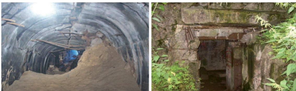
Fot. 4. Schron bojowy Pz.W866 (2015 r.)

kopułą pancerną. Połączony był chodnikiem ze schronem centralnym, stąd nie posiada osobnego wejścia. Obecnie istnieje bezpośredni dostęp do niego dzięki oderwaniu części kopuły pancernej w efekcie wysadzenia ładunkiem wybuchowym. Wskutek wybuchu zasypany został podziemny chodnik, co uniemożliwia przedostanie się nim do schronu centralnego. W tym przypadku zachowane zostało ok. 35% konstrukcji obiektu (fot. 5).