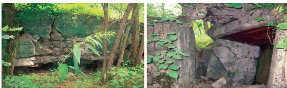
Fot. 2. Schron bojowy Pz.W.864 (2015 r.)