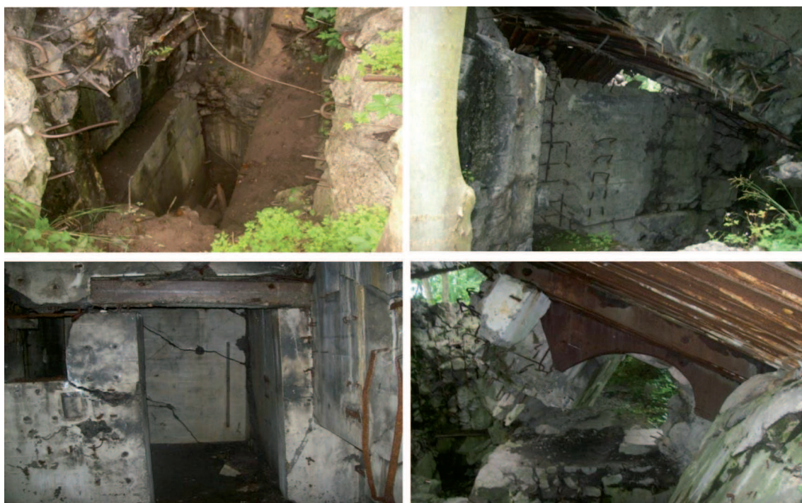
Fot. 1. Schron bojowy Pz.W.865 (2015 r.)