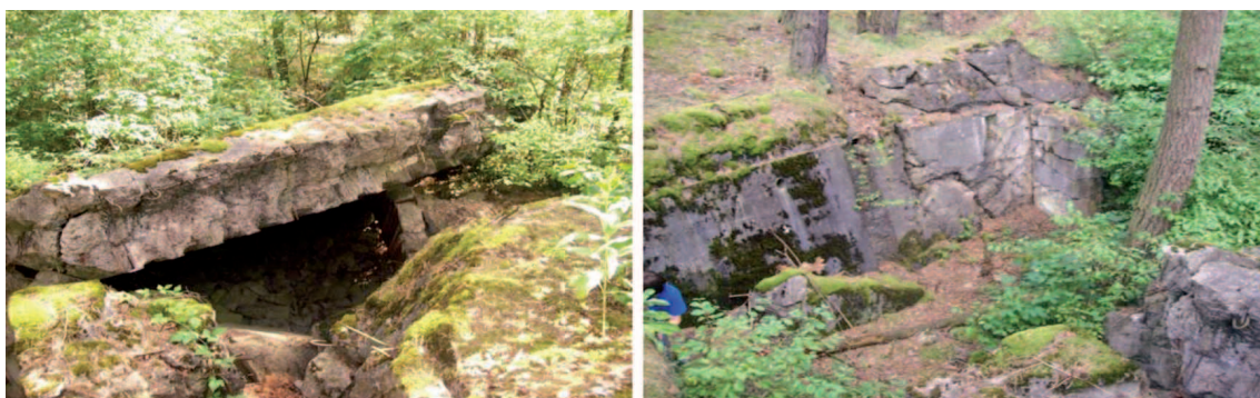
Fot. 8. Schron bojowy Pz.W.874 (2015 r.)

buchowych. W przypadku pierwszego z wymienionych schronów zachowało się 40%, a w przypadku drugiego – 20% pierwotnej konstrukcji. W podobnym stanie zachował się schron Pz.W.873 znajdujący się pomiędzy Grupą Warowną Ludendorff a schronem Pz.W.874. Wszystkie te obiekty wymagają dużej ostrożności przy ich zwiedzaniu.