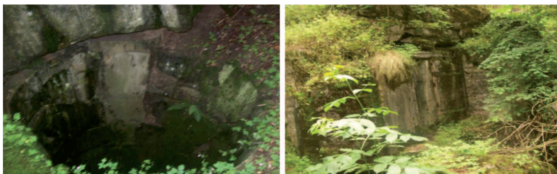
Fot. 6. Schron bojowy Pz.W.868 (2015 r.)

elewacji lewego skrzydła obiektu. W bliskiej odległości od skrzyżowania drogi nr 3 z drogą nr 24 znajduje się schron bojowy Pz.W. 875. Został on wzniesiony na przełomie lat 1935 i 1936. W odróżnieniu od dwóch powyższych obiektów ten zachował się w stosunkowo dobrym stanie (ok. 70% pierwotnej konstrukcji). Była to duża, dwukondygnacyjna budowla o charakterystycznym, przysadzistym kształcie (fot. 7).