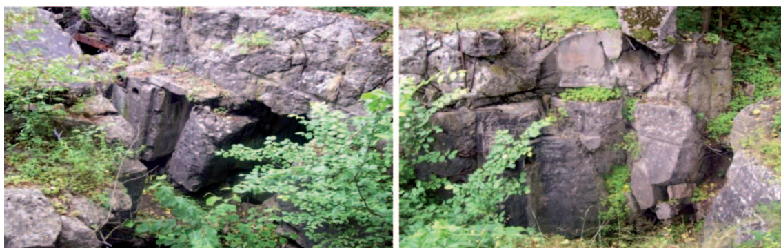
Fot. 3. Schron bojowy Pz.W.863 (2015 r.)