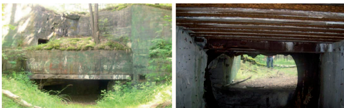
Fot. 7. Schron bojowy Pz.W.875 (2015 r.)

elewacji lewego skrzydła obiektu. W bliskiej odległości od skrzyżowania drogi nr 3 z drogą nr 24 znajduje się schron bojowy Pz.W. 875. Został on wzniesiony na przełomie lat 1935 i 1936. W odróżnieniu od dwóch powyższych obiektów ten zachował się w stosunkowo dobrym stanie (ok. 70% pierwotnej konstrukcji). Była to duża, dwukondygnacyjna budowla o charakterystycznym, przysadzistym kształcie (fot. 7).