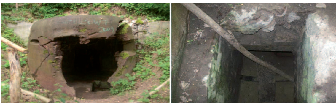
Fot. 5. Schron bojowy Pz.W.867 (2015 r.)

kopułą pancerną. Połączony był chodnikiem ze schronem centralnym, stąd nie posiada osobnego wejścia. Obecnie istnieje bezpośredni dostęp do niego dzięki oderwaniu części kopuły pancernej w efekcie wysadzenia ładunkiem wybuchowym. Wskutek wybuchu zasypany został podziemny chodnik, co uniemożliwia przedostanie się nim do schronu centralnego. W tym przypadku zachowane zostało ok. 35% konstrukcji obiektu (fot. 5).