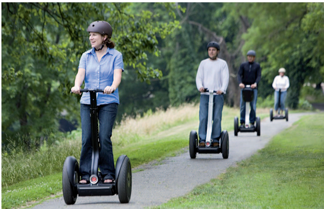
Fot. 4. Wycieczka turystyczna segwayami

– segway typu HT lub PT (ang. Segway Human lub Personal Transporter ) – dwuśladowy, dwukołowy, jednoosobowy pojazd elektryczny, zasilany elektrycznie i sterowany komputerowo, który jest odpowiedzialny za utrzymanie równowagi (fot. 4).