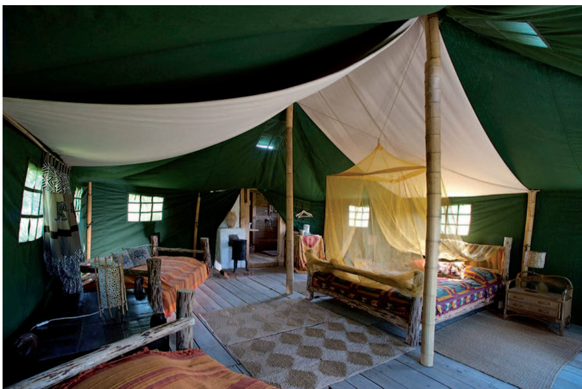
Fot. 2. Glamping w Glendoria Park, Polska

Z kolei Pop-Up Hotels opracowuje nietypowe lokalizacje luksusowo wyposażonych miasteczek namiotowych, umieszczając je w interesujących miejscach w Wielkiej Brytanii 15 . Taki trend, zwany glamping (od ang. glamour i camping ), definiowany jest jako połączenie luksusu z tradycyjnym kempingiem, i obejmuje obiekty campingowe o bardzo wysokiej klasie i doskonałej lokalizacji 16 . Jego idea powstała na początku XX w. podczas safari. Glamping dotyczy głównie luksusowych namiotów, ale włączone w jego zakres zostały również inne obiekty o zbliżonej klasie i profilu (np. przyczepy, stodoły, gospodarstwa, domki, altany, jurty). Pierwszym obiektem tego typu w Polsce jest Glendoria Park 17 , którego przykładowy obiekt noclegowy prezentuje fot. 2.