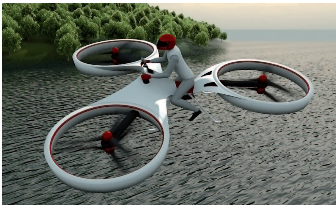
Fot. 3. Projekt Flika – drona załogowego (flicoptera)