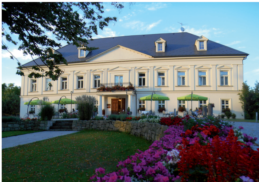
Fot. 4. Myśliwski pałac w stylu empire w Prstnej