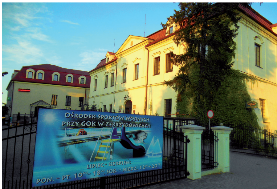
Fot. 6. Dobudowana sala widowiskowa do zamku w Zebrzydowicach oraz banery i świecące reklamy przy zamku