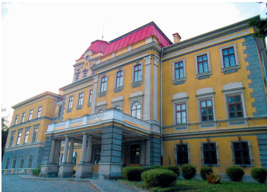
Fot. 1. Klasycystyczny pałac w Kończycach Wielkich