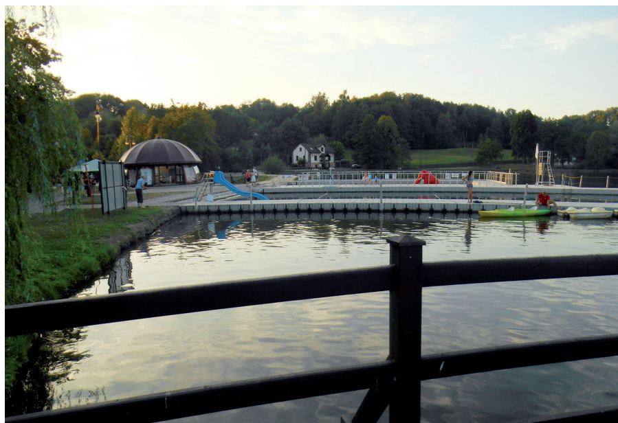
Fot. 7. Ośrodek sportów wodnych na stawie przyzamkowym Młyńszczok w Zebrzydowicach