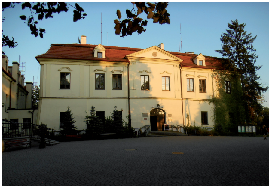
Fot. 3. Barokowy zamek w Zebrzydowicach (fot. W. Kurda)