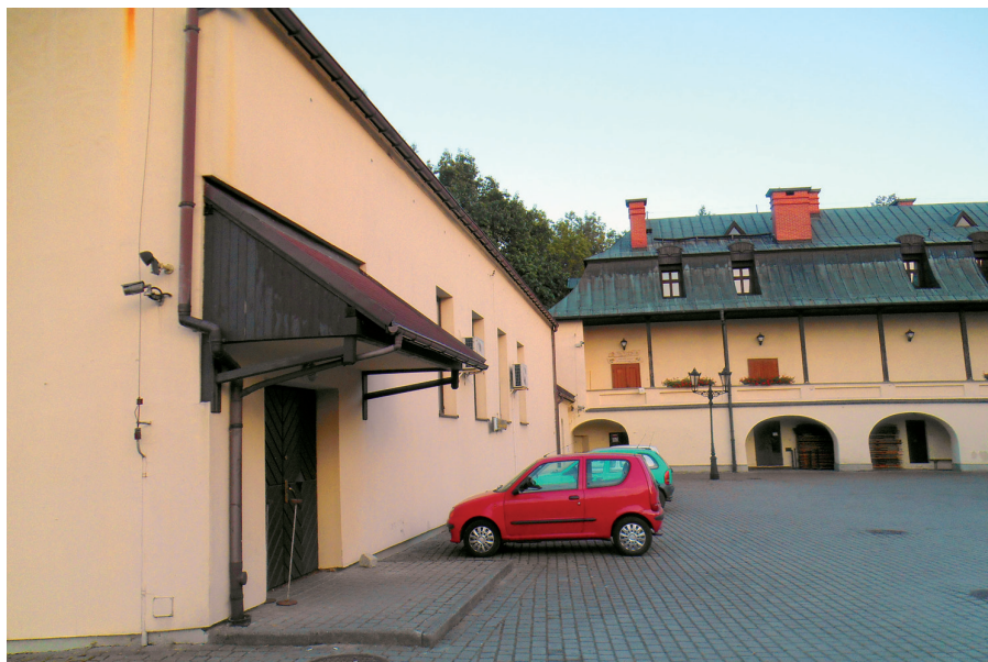
Fot. 5. Dobudowana sala widowiskowa do zamku w Kończycach Małych

Rozbudowa/przebudowa pałacu i jej zakres: w 1960 r. dobudowano trzecie skrzydło zamku – salę widowiskową, zaburzając oryginalną substancję zabytkową (fot. 5).