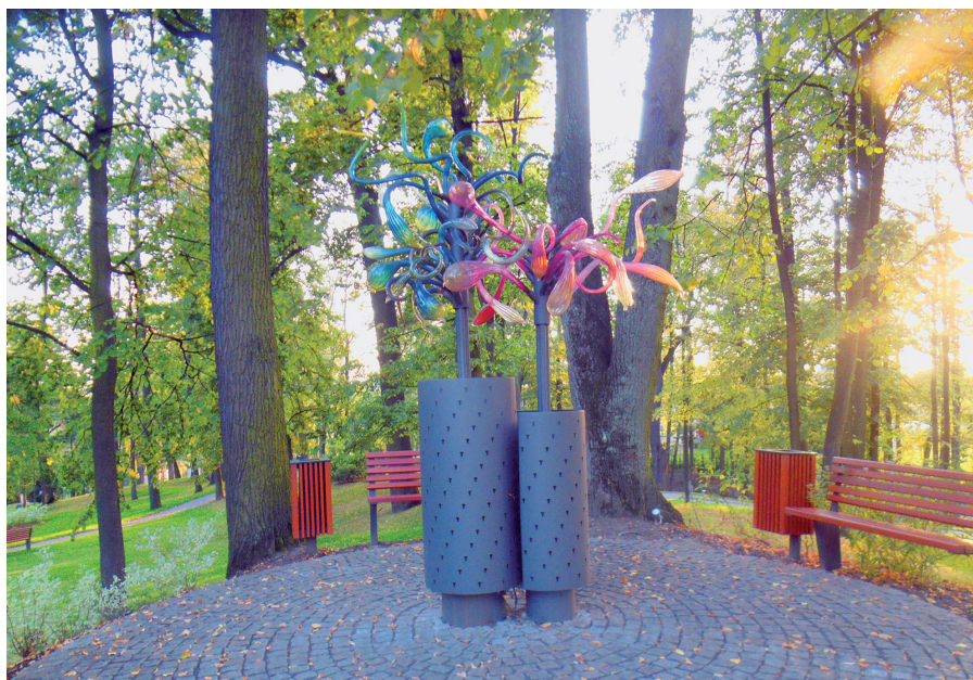
Fot. 8. Nowoczesne rzeźby w zabytkowym parku przypałacowym w Prstnej

Zabytkowe cechy architektoniczne pałacu: w fasadzie tympanon bez płaskorzeźby, pilastry jońskie przy balkonie na I piętrze, dekoracyjne obramienia okien, lizeny, kolumny podtrzymujące balkon, we wnętrzu zabytkowa boazeria angielska i drewniany parkiet.