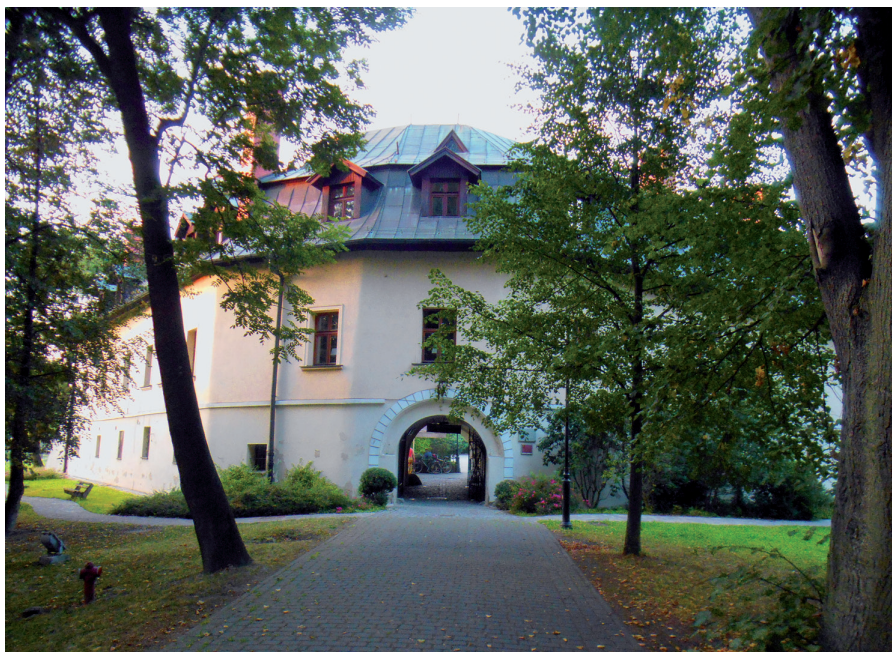
Fot. 2. Renesansowy zamek w Kończycach Małych