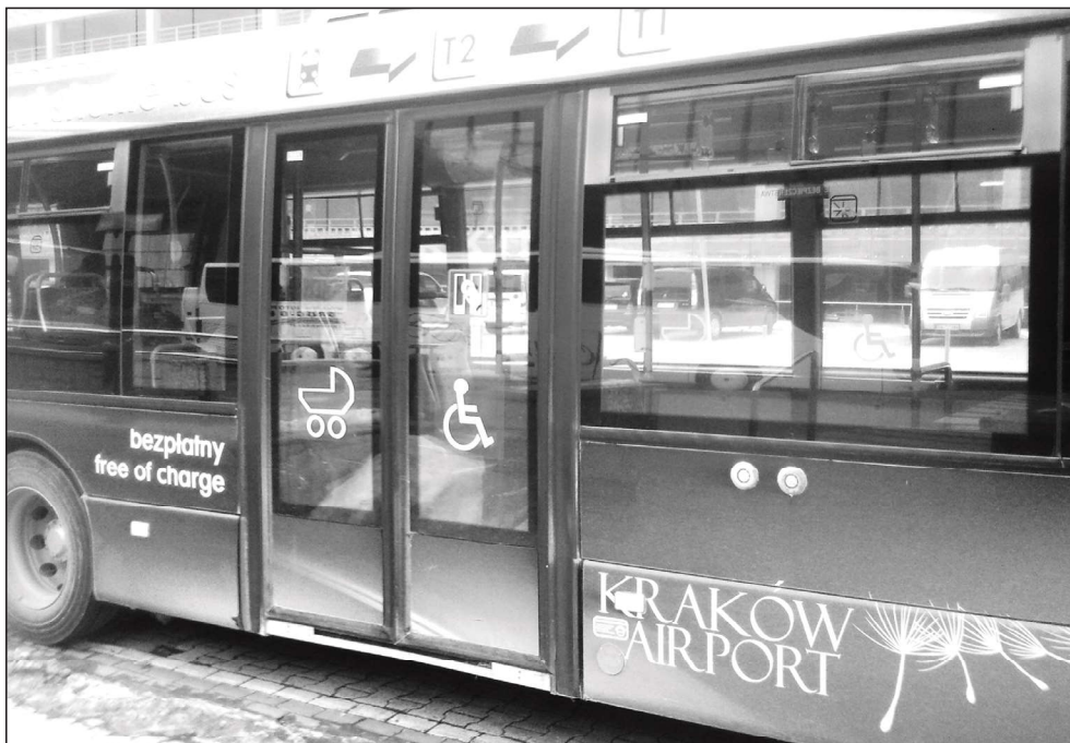
Fotografia 2. Autobus wahadłowy na lotnisku Kraków – Balice

narodowym, dworcem kolejowym a terminalem krajowym kursuje bezpłatny autobus również przystosowany do potrzeb wszystkich turystów (Fot. 2).