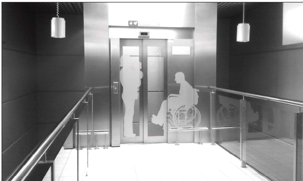
Fotografia 4. Winda dla niepełnosprawnych

Infrastruktura krakowskiego lotniska obejmuje również punkty przywoławcze „help point”, pozwalające na bezpośrednie wezwanie pracowników asysty. Ponadto przystosowane toalety, telefony do użytku osób niepełnosprawnych oraz windy przyjazne osobom z dysfunkcjami, posiadające informację wizualną (Fot. 4). Na całym lotnisku wprowadzono także wizualno-dźwiękowy system informacji. Informuje on o lotach, jak również i innych komunikatach. Wyświetlane są na ekranach w formie wizualnej, jak i formie dźwiękowej przez system nagłośnienia lotniska.