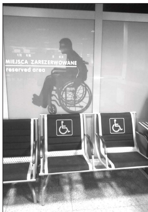
Fotografia 3. Powyżej stanowisko do odpraw turystów niepełnosprawnych, poniżej telefon do użytku osób na wózkach (po lewej) oraz miejsca zarezerwowane (po prawej)