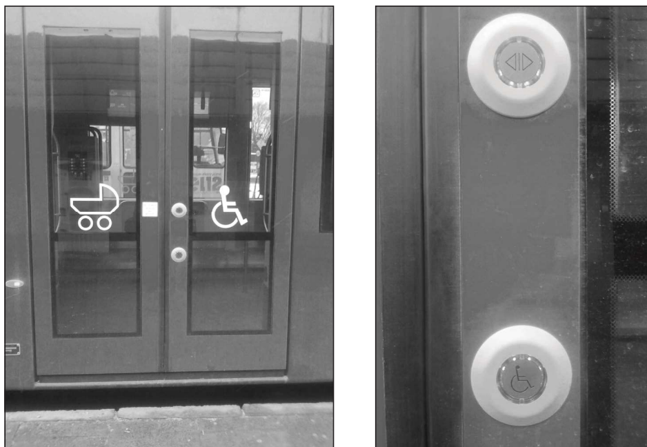
Fotografia 5. Dodatkowe przyciski dla niepełnosprawnych do otwierania drzwi w komunikacji miejskiej

W tramwajach, jak i autobusach częstym problemem jest „obsługa” tych pojazdów. Przyciski do otwierania drzwi sąsiadują z przyciskami awaryjnymi, lub znajdują się za wysoko. W Krakowie rozwiązano ten problem poprzez wprowadzenie przycisków często opisanych dodatkowo alfabetem Braille’a, dzięki czemu osoby niedowidzące nie popełnią błędu. Ponadto dodano specjalne przyciski z emblematem osoby niepełnosprawnej, które znajdują się niżej od tradycyjnych, umożliwiając tym samym podróżowanie bez barier dla osób na wózkach (Fot. 5). Dzięki tym działaniom komunikacja miejska w Krakowie przestaje być niedostępna dla osób niepełnosprawnych.