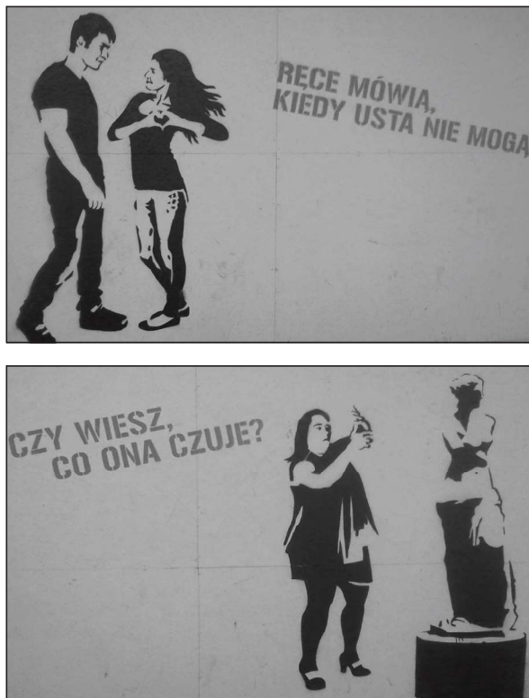
Fotografia 1. Rysunki na Regionalnym Dworcu Autobusowym w Krakowie