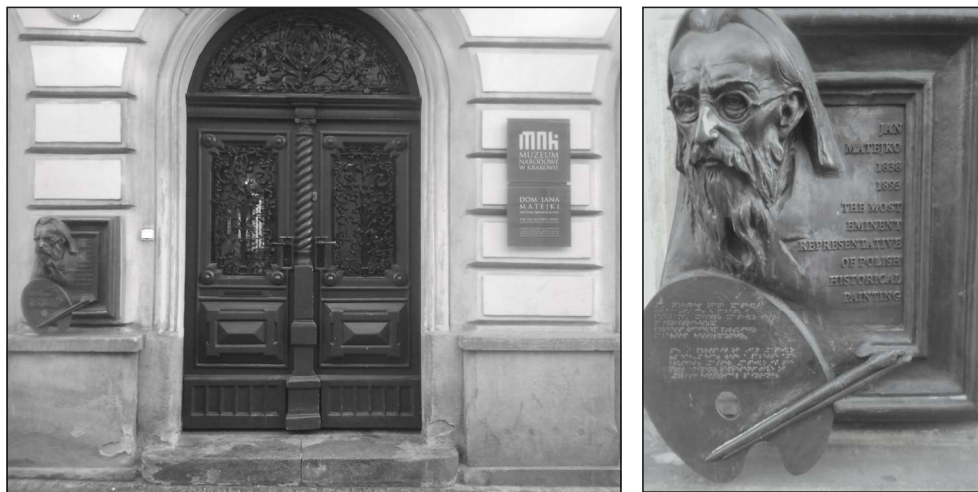
Fotografia 7. Fasada domu Jana Matejki z makieta wiszącą portretu artysty