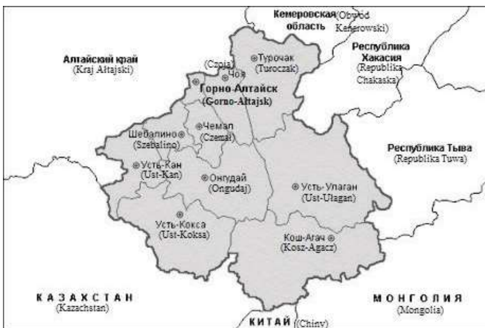
Rycina 1. Mapa rejonów Republiki Altaju

Republika Altaju ma powierzchnię 92902 km 2 i charakteryzuje się bardzo urozmaiconym ukształtowaniem terenu, które zostało, jak wspomniano, dostrzeżone przez przedstawicieli UNESCO. To właśnie walory związane z interesującym krajobrazem, różnorodnością flory i fauny oraz sferą kulturową stanowią podstawę atrakcyjności turystycznej tego obszaru.