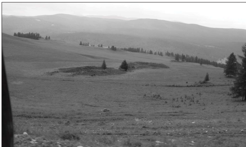
Fotografia 2. Kurhany charakteryzują się wyjątkowo dużymi rozmiarami