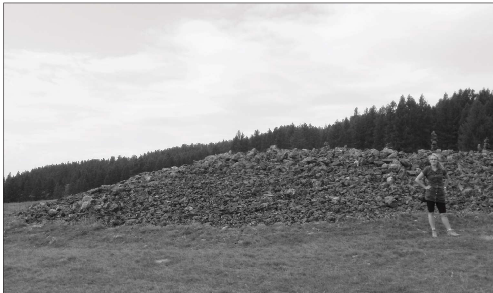
Fotografia 1. Kurhany w Pazyryku

tografia 2), wiekiem i usytuowaniem w otoczeniu surowej syberyjskiej przyrody (Urbaniak 2013).