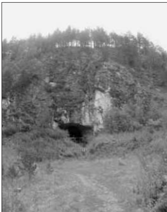
Fotografia 4. Jaskinia Denisowa

Jaskinia Denisowa (fot. 4.), która swą nazwę zawdzięcza rosyjskiemu badaczowi eksplorującemu jej wnętrze, jest miejscem bardzo interesującym z racji odkryć archeologicznych w niej dokonanych. Jaskinia znajduje się na granicy Republiki i Kraju Ałtajskiego, w regionie ust-kańskim. We wnętrzu niezbyt dużej pieczary rozpoznano do tej pory elementy związane z bytowaniem około 20 różnych warstw kulturowych 7 . Sensacyjnego odkrycia dokonali naukowcy w 2008 roku, natrafiając na kość paliczka kilkuletniej dziewczynki. Wnikliwsze badania potwierdziły, że DNA pobrane ze znaleziska nie