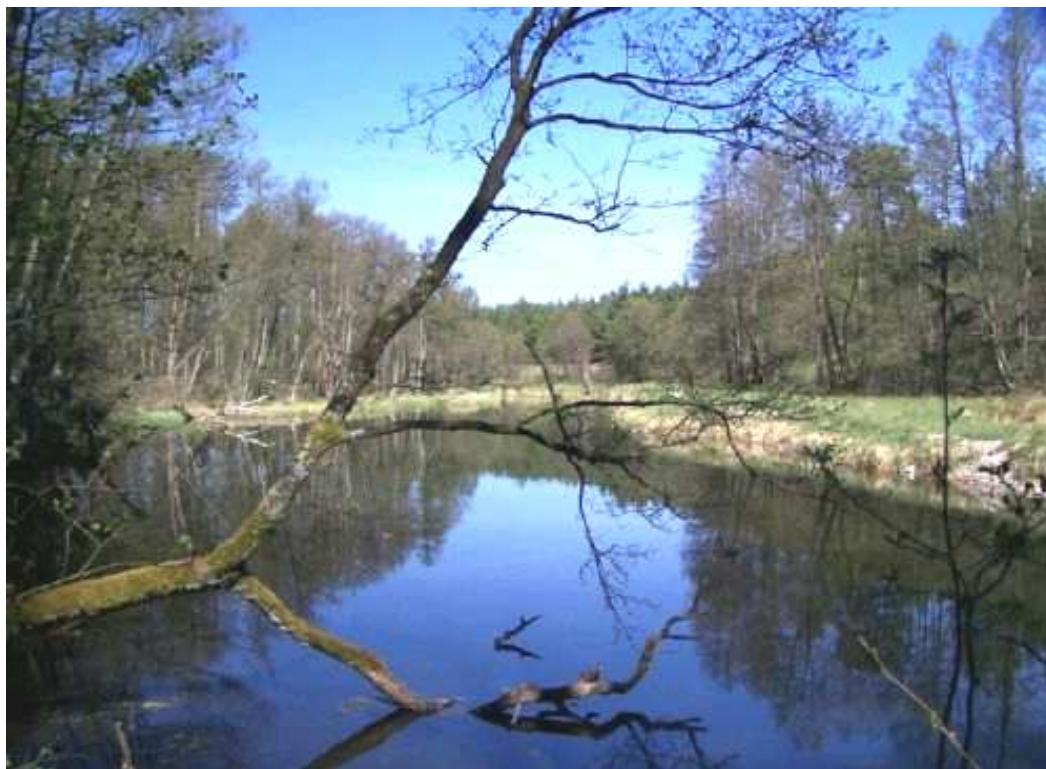
Ryc. 1. Rzeka Wda na obszarze Kociewia

Uroku dodają rzece las, liczne zakola, mocno rozczłonkowane rozlewiska, a także przepiękne, wąskie zatoczki. Najpiękniejsze odcinki na trasie rzeki to np: pomniki przyrody, jak głaz narzutowy w wodzie w miejscowości Czarna Woda, przybrzeżne 500-600 letnie dęby we Wdeckim Młynie (dąb Samotniki około 900-letni), rezerwat przyrody „Krzywe Koło” i rezerwat bobrów w Błędnie, zaś perłą krajobrazową jest przybrzeżna wieś letniskowo-wypoczynkowa Tleń. Partie wysokiego brzegu, kilkunastometrowe skarpy, czysta woda, niekiedy wartko płynąca - wszystko to robi wrażenie rzeki górskiej, słowem idealna trasa dla kajakarzy.