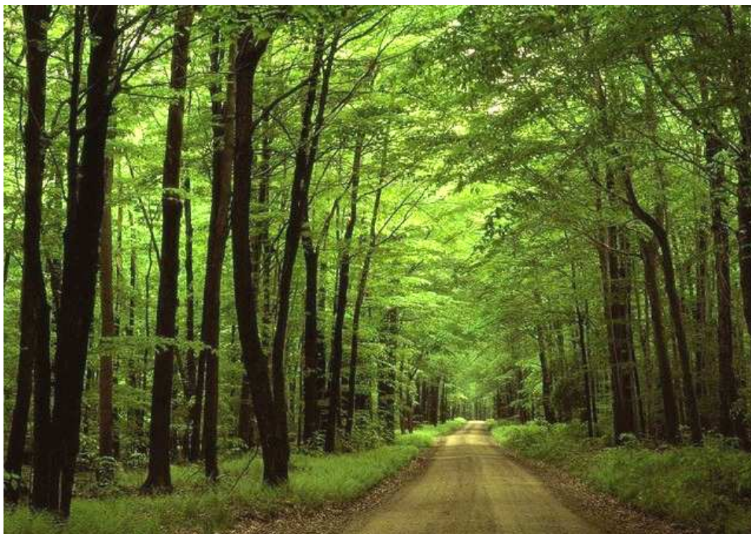
Ryc. 3. Las liściasty w Borach Tucholskich

Piękno Borów i przyrody kociewskiej ma swoje odzwierciedlenie w kilkunastu rezerwach, parkach krajobrazowych jak i ponad 300 pomnikach przyrody stanowiących relikty dawnych krajobrazów. Te wszystkie atuty przyrodnicze i krajobrazowe przyciągają turystów i wczasowiczów w każdej porze roku. Wiosną wabią zapachem konwalii, latem zaś nagrzaną od słońca żywicą sosen. Niezwykle piękna jest jesień w Borach, kiedy żółkną, brązowieją i czerwienieją liście brzoź, grabów, buków i dębów. Pełne uroków są też lasy w porze zimowej, pokryte puszystym całunem śniegu 12 .