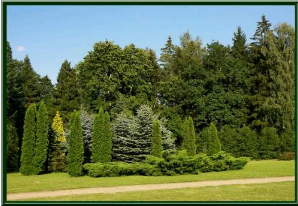
Ryc. 6. Ogród dendrologiczny w Wirtach

Największym obiektem chronionym w województwie pomorskim jest Obszar Chronionego Krajobrazu Borów Tucholskich. Na obszarach chronionego krajobrazu ogranicza się rozwój przemysłu, by zapobiegać zanieczyszczeniu i szpeceniu ciekawego krajobrazu. Bory są jednym z największych kompleksów leśnych w Polsce. Zajmują powierzchnię 1170 km 2 . Ochronie podlega tutaj przeważająca część Borów Tucholskich w granicach województwa od Osieka po Wdzydzki Park Krajobrazowy. Występują tu: Park Narodowy Bory Tucholskie, parki krajobrazowe Zaborski i Tucholski (częściowo w woj. pomorskim), kilka rezerwatów przyrody oraz Chojnicko-Tucholski Obszar Chronionego Krajobrazu i Obszar Chronionego Krajobrazu, fragment Borów Tucholskich. Główną rzeką regionu jest Wda.