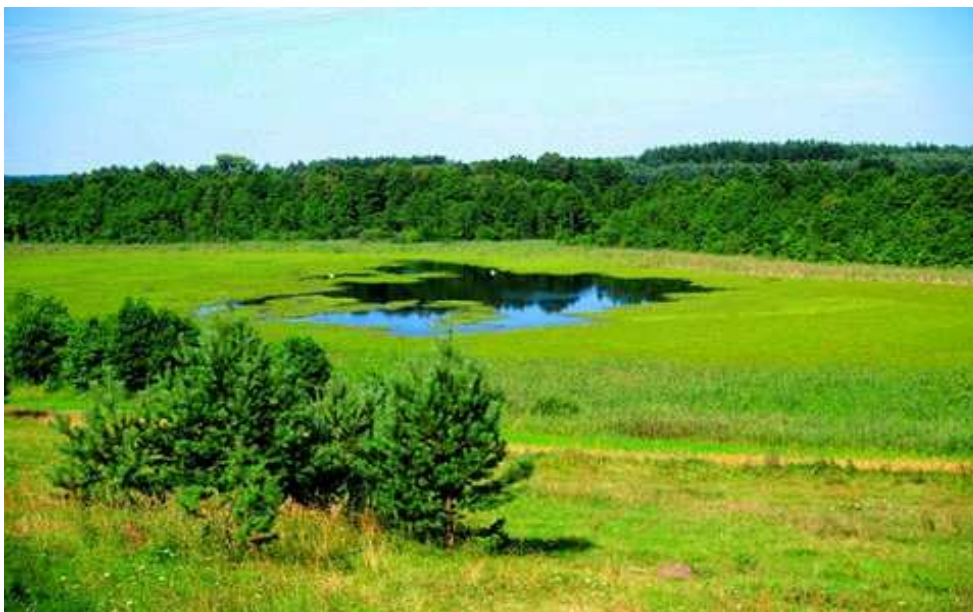
Ryc. 5. Rezerwat przyrody Jezioro Udzier

Na uwagę zasługuje także Rezerwat Leśny „Brzęczek”, w którym pod ochroną znajdują się zbiorowiska żyznej i kwaśnej buczyny pomorskiej z okazałym 160-letnim drzewostanem. Oprócz tego znajdują się tutaj także stanowiska rzadkich i chronionych roślin naczyniowych 25 .