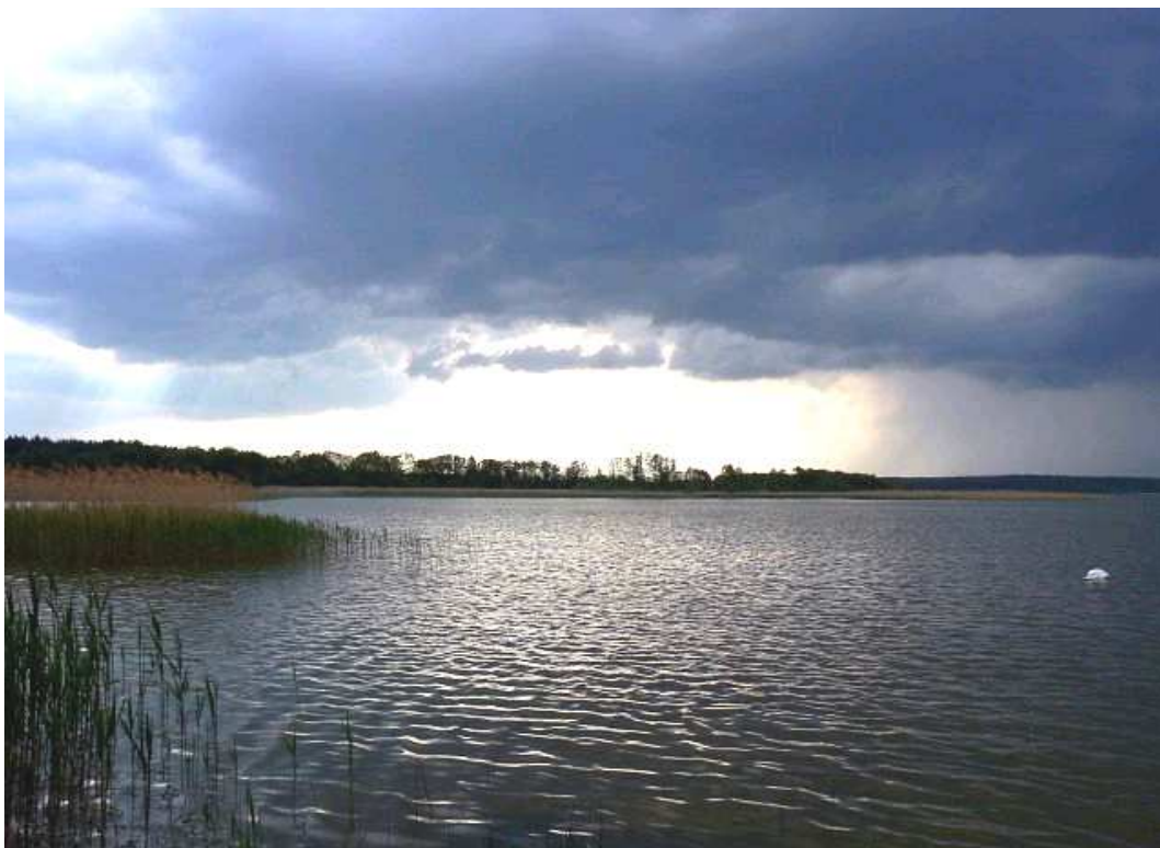
Ryc. 2. Jezioro Kałębie koło Osieka