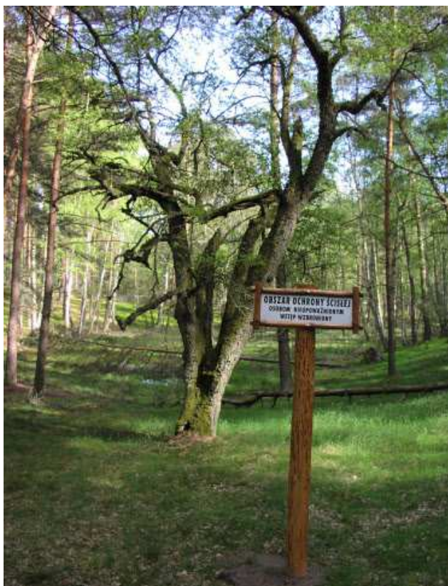
Ryc. 4. Park Krajobrazowy Bory Tucholskie

Do najważniejszych parków krajobrazowych Borów Tucholskich i Kociewia zaliczyć można Tucholski Park Krajobrazowy (TPK), który został utworzony w 1985. Siedzibą parku jest Tuchola. Zajmuje on południowo-wschodnią część Borów o powierzchni około 37 000 ha. Główną rzeką płynącą przez park jest rzeka Brda. Na szczególną uwagę zasługuje jej odcinek w miejscowości Świt, gdzie skupienie głazów narzutowych i strome brzegi doliny nadają rzece charakter górski. Ponad 85% powierzchni parku stanowią lasy. Największą atrakcją turystyczną Tucholskiego Parku Krajobrazowego jest szlak kajakowy rzeki Brdy o europejskiej renomie, przebiegający na całej długości parku od Rytle do miejscowości Piłamłyn 15 .