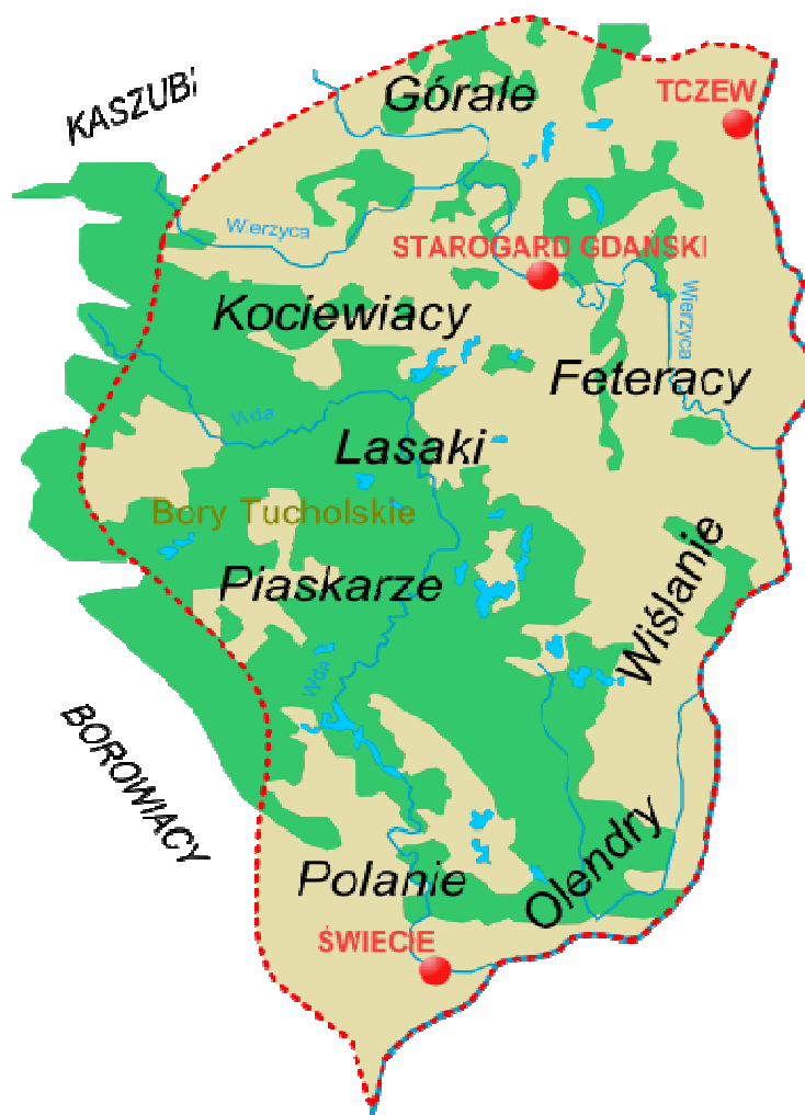
Ryc. 7. Mapa grup etnicznych niegdyś zamieszkujących tereny Kociewia

Kociewie ciągle budzi zainteresowanie, a przede wszystkim sama nazwa tego regionu. Nie udało się jeszcze naukowcom ustalić w sposób jednoznaczny i ostateczny pochodzenia, źródeł i znaczenia tej nazwy. Istnieje wiele wersji i propozycji etymologicznych, a każda z nich budzi różnorodne wątpliwości. Jedni wywodzą tę nazwę od kociołków tzn. niewielkich bezodpływowych zagłębień terenowych, inni natomiast od słów kaszubskich jak: „kunc(z)”- koniec, „końcevi”- końcowy, w sensie krainy położonej na końcu Kaszub, „koncevati”- obozować lub od j. rosyjskiego „koczewie”- koczowisko 32 . Jeden ze współczesnych historyków i pisarzy Pomorza Gdańskiego Stanisław Kujot twierdzi, że nazwa Kociewie wywodzi się od rzeczownika „kacza” oznaczającego szałas, kuczę tj. kaszubską checę. Takie checze stawiali sobie osadnicy sprowadzani na te ziemie w XIV wieku przez opata cystersów