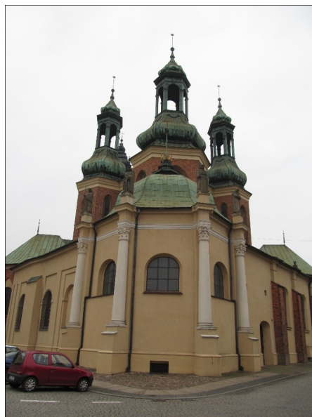
Fot. 4 i 5. Katedra w Poznaniu, widok od strony zachodniej i wschodniej