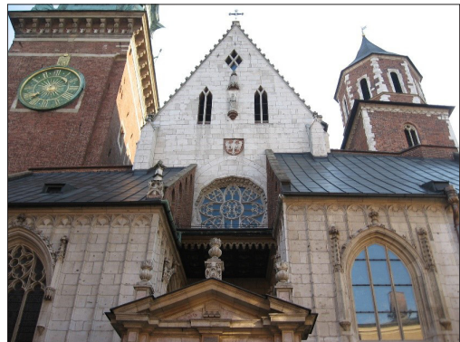
Fot. 2 i 3. Katedra na Wawelu, widok od strony południowej i zachodniej