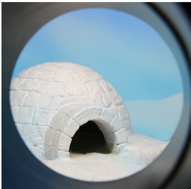
Rys. 6. Diorama przedstawiająca igloo. Fragment wystawy „Stan zagrożenia” w schronie na os. Szkolnym 37

o tym, co jest potrzebne, aby czuć się bezpiecznie. W trakcie warsztatów plastycznych pt. „Co łączy dziecięcia i igloo?” uczestnicy, na podstawie przeprowadzonej dyskusji, tworzą swoje własne projekty plastyczne bezpiecznych baz.