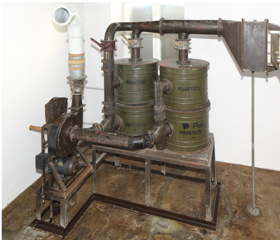
Rys. 3. Zespół filtrowentylacyjny. Fragment wystawy „Stan zagrożenia” w schronie na os. Szkolnym 37

i ton narracji, pozwalając zainteresować i zaprosić do odkrywania schronów na różnych płaszczyznach. Dodanie określenia, że jest to dziedzictwo zimnej wojny, sprawia, że zasób ten staje się czytelny dla ludzi z całego świata, sytuuje go w czasie, a także mocno eksponuje w kontekście Nowej Huty i jej historii. (Zarzycka 2017, s. 2)