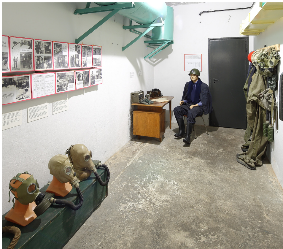
Rys. 2. Fragment wystawy „Atomowa groza. Schrony w Nowej Hucie” w Muzeum Nowej Huty

zlokalizowanej w podziemiach budynku dawnego kina Światowid. Ekspozycja, wciąż czynna, rozpoczyna się opowieścią o propagandzie 2. połowy XX w. oraz o zimnej wojnie. Dalsza narracja jest skoncentrowana przede wszystkim na historii obrony cywilnej i budownictwa schronowego w PRL oraz specyfice infrastruktury schronowej w Nowej Hucie. Najważniejszą częścią wystawy jest przestrzeń schronu przeciwlotniczego.