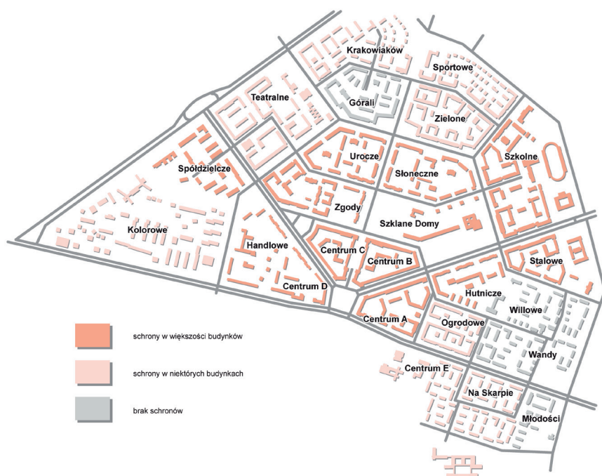
Rys. 1. Mapa obrazująca rozmieszczenie schronów na terenie Nowej Huty

Od 2015 r. trwają prace nad projektem Podziemna Nowa Huta, mającym na celu udostępnienie kilku nowohuckich schronów do celów wystawienniczych 4 . Działania te od samego początku prowadziło Muzeum PRL-u, zlokalizowane w budynku dawnego nowohuckiego kina Światowid. Dnia 1 marca 2019 r. Muzeum PRL-u i Muzeum Historyczne Miasta Krakowa połączyły się w Muzeum Krako-