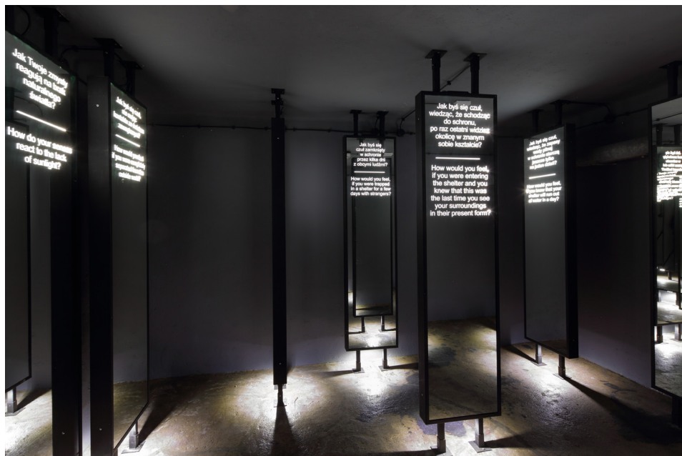
Rys. 7. Fragment wystawy „Stan zagrożenia” w schronie na os. Szkolnym 37

Pod szklanym kloszem w kolejnej sali znajduje się makieta, która obrazuje pożądaną w latach 80. XX w. stan schronu. Służy ona do celów edukacyjnych – oglądając układ, elementy i wyposażenie miniaturowego schronu, można dostrzec duży kontrast w stosunku do przestrzeni schronu zwiedzanego. To skłania do refleksji nad stanem przygotowania budowli ochronnych w Polsce lat 50. XX w.