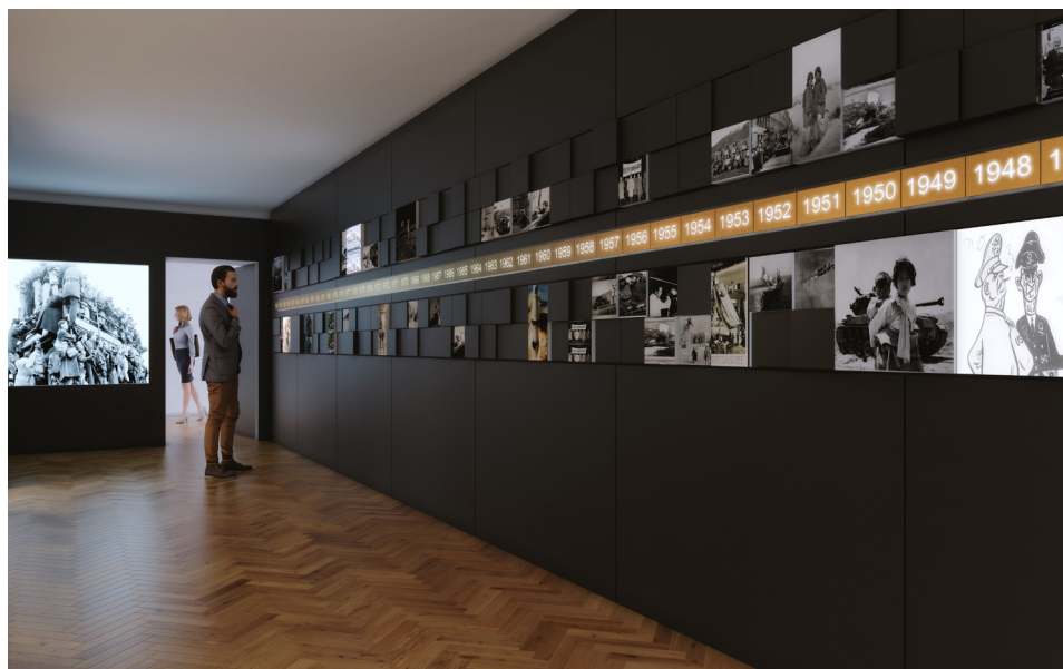
Rys. 4. Wizualizacja fragmentu wystawy planowanej w centrum Podziemnej Nowej Huty

Centrum Podziemnej Nowej Huty (os. Szkolne 22) z ekspozycją „Schrony w Nowej Hucie – duch miejsca, duch czasu” znajdzie się w obiekcie, gdzie do dyspozycji muzeum pozostaje zarówno schron pod budynkiem, jak i wyższe kondygnacje. Na parterze zostaną przygotowane segmenty wprowadzające poświęcone zimnej wojnie („duchowi czasu”) i Nowej Hucie („duchowi miejsca”) oraz budownictwu schronowemu (zob. rys. 4). W samym schronie planowany jest m.in. segment z pytaniami skierowanymi do zwiedzających, np.: „Jak wykonać sztucz-