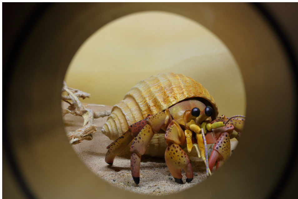
Rys. 5. Diorama przedstawiająca kraba pustelnika. Fragment wystawy „Stan zagrożenia” w schronie na os. Szkolnym 37

jako Podziemna Nowa Huta – filia Muzeum Nowej Huty (schron pod Zespołem Szkół Mechanicznych nr 3, os. Szkolne 37). Składa się z czterech segmentów 9 . Pierwsza sala dotyczy potrzeby schronienia się przed zagrożeniem naturalnym, przed przeciwnikiem, co jest czymś zupełnie instynktownym i normalnym, zarówno dla zwierząt, jak i ludzi. W tym segmencie wystawy znajdują się dioramy i filmik, które pokazują, jak różne mogą być sposoby i formy schronienia. Można tu zobaczyć m.in. mrowisko, żółwia chowającego się w swojej skorupie, lisa wyglądającego z nory, igloo czy twierdzę (zob. rys. 5 i 6). Celem takiego zorganizowania przestrzeni jest to, by zwiedzający zrozumiał ideę schronu i dostrzegł szeroko pojęte „schrony” w otoczeniu (Zarzycka 2017, s. 35), co wpisuje się szczególnie w drugą zasadę interpretacji Tildena (2019). Sala „Potrzeba schronienia” cieszy się szczególnie zainteresowaniem wśród młodszych odbiorców. Zarówno w przypadku rodzin, jak i grup zorganizowanych dzieci często nie mogą się oderwać od wizjerów, przez które oglądają dioramy. Podczas zajęć z edukatorem zastanawiają się nad wspólnym mianownikiem, który łączy wszystko, co zaobserwowali. Taki zabieg stanowi też doskonały punkt wyjścia do rozmowy