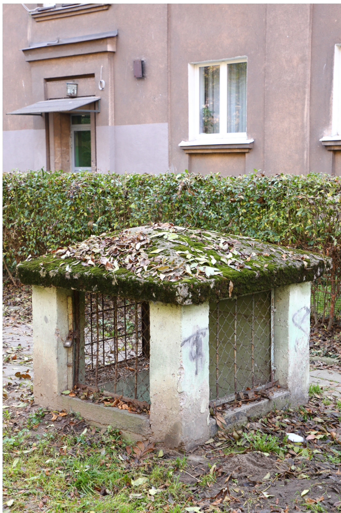
Rys. 8. Wylaz z tunelu ewakuacyjnego, os. Szkolne 33

pozytywnego lub negatywnego wydźwięku wskazanemu zdaniu (w celu objaśnienia mechanizmów propagandy) czy burza mózgów dotycząca współczesnych zagrożeń oraz możliwości ochrony przed nimi i zapobiegania im. Podkreślana jest tu m.in. konieczność dbania o bezpieczeństwo swoje i innych w sytuacji trwającej pandemii oraz kwestia ostrożnego, bezpiecznego korzystania ze świata cyfrowego. Zabieg wpisuje się szczególnie w pierwszą i czwartą zasadę interpretacji Tildena (2019). Na formę zdalną zostały także „przełożone” wspomniane już warsztaty plastyczne dla najmłodszych pt. „Co łączy dziecięta i igloo?”, podczas których uczestnicy, zainspirowani pogawędką o bezpiecznych kryjówkach zwierząt i ludzi, tworzą swoje własne projekty plastyczne bezpiecznych baz.