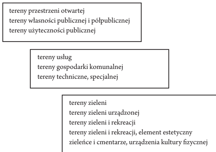
Rysunek 1. Miejsce cmentarzy w klasyfikacjach użytkowania ziemi

W polskich publikacjach dotyczących użytkowania ziemi w miastach, w zależności od autora (Bromek, 1966; Liszewski, 1973), cmentarze są różnie klasyfikowane. Zasadniczo można wyróżnić trzy grupy funkcji przypisywanych cmentarzom. Są to tereny związane z użytecznością publiczną, tereny gospodarki komunalnej i usług oraz tereny zieleni. Cmentarze śródmiejskie ze względu na swoistą „nietykalność” stanowią istotną część terenów zieleni miejskiej i w zależności od przyjętej klasyfikacji zaliczane są do terenów zieleni, terenów zieleni urządzonej, terenów zieleni i rekreacji, zieleńców i cmentarzy oraz urządzeń kultury fizycznej (rys. 1). W klasyfikacji terenów zieleni opracowanej przez Instytut Urbanistyki i Architektury w 1951 r. cmentarz został zaklasyfikowany do terenów zieleni o specjalnym przeznaczeniu i o ograniczonej dostępności. W klasie tej oprócz cmentarzy znalazły się parki i ogrody zabytkowe, pracownicze ogrody działkowe oraz ogrody dydaktyczne.