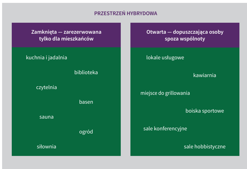
Rys. 3. Hybrydowa przestrzeń rekreacyjna cohousingu

przywiązania do miejsca (przestrzeni zamkniętej) i na motywację do podejmowania aktywności społecznej na rzecz tego miejsca (społeczną aktywność członków wspólnoty), ale również poza nim. W celu minimalizacji negatywnych społecznych następstw wynikających z zamknięcia przestrzeni rekreacyjnej w ramach cohousingu warto tworzyć pomosty pomiędzy zamkniętością (czysto prywatną zamkniętą przestrzenią wspólną cohousingów) a otwartością (w pełni otwartą dla każdego przestrzenią publiczną) w postaci różnych gradacji tej przestrzeni. Cohousing można potraktować jako swoisty rodzaj siedziby rodzinnej. Ta zaś według Znanieckiego (1938, s. 96–101) może dopuścić ludzi pierwotnie do niej nienależących, którym mieszkańcy wyznaczają określone role (np. w zakresie działalności rekreacyjnej), co wiąże się jednak z koniecznością wniesienia do grupy pozytywnej wartości. Pozycje ekologiczne dopuszczonych gości są ściśle zależne od rodzaju funkcji, które spełniają oni na rzecz zespołu rodzinnego. Przykładem takiego działania jest zaproszenie do udziału w organizowanych w przestrzeniach wspólnych cohousingu zajęciach rekreacyjnych mieszkańców okolicznych regionów. Dzięki temu cohousingi mogą stabilizować dzielnice miast i pozytywnie wpływać na integrację społeczną, ze względu na ofertę skierowaną do lokalnych społeczności. Otwarcie przestrzeni może dotyczyć konkretnych usług świadczonych przez